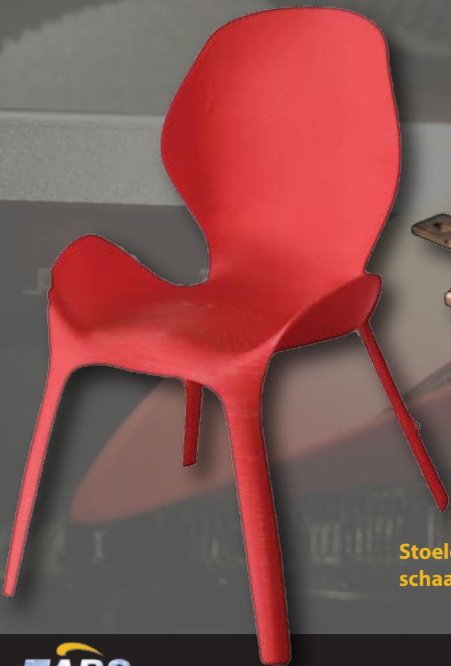
Stoelontwerp schaal 1:10