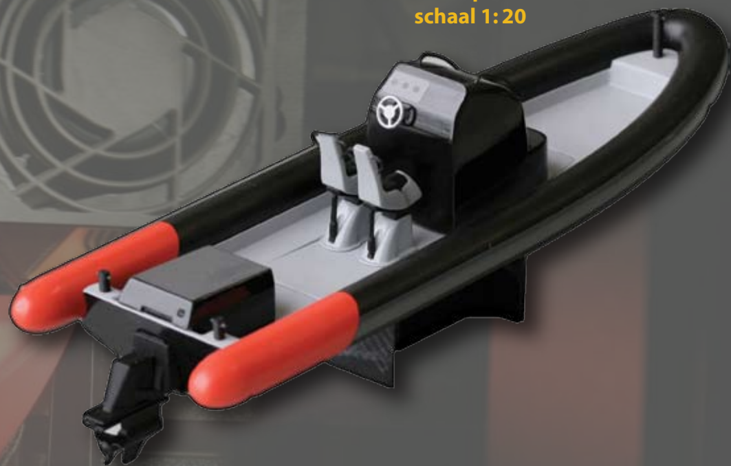
Scheepsmodel schaal 1:20