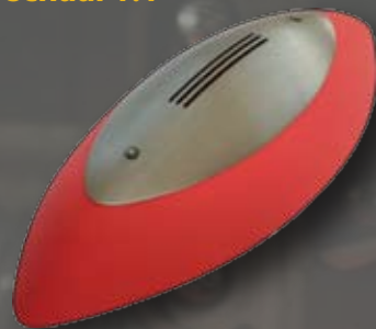
glazen lampenkap schaal 1:1